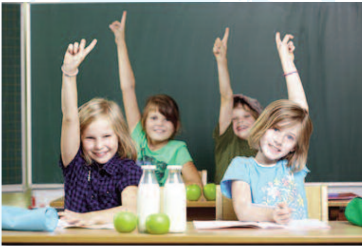
Abb. 1: Wissen ist ein Menschenrecht. Niemand darf dieses Recht auf Bildung unterdrücken.

Das Recht auf Bildung ist ein Menschenrecht. Keinem Unternehmen darf es erlaubt sein, Wissen nur zur Sicherung seines Profits, zum Schaden des Gemeinwohls zu unterdrücken oder zu manipulieren. Es gibt jedoch Interessensgruppen, die fortschrittliche Technologien und neue wissenschaftliche Ergebnisse tatsächlich nicht nutzen, weil deren Anwendung erhebliche Umsatz- und Gewinnrückgänge mit sich bringen würde. Beherrschende Monopolstellungen wären in Gefahr bzw. würden durch neue Technologien und wissenschaftliche Anwendungen nichtig. Als Beispiele für veraltete Technologien seien die Energieproduktion auf Basis fossiler Energieträger (siehe Newsletter 04-2013) sowie die Produktion chemisch erzeugter, lediglich symptomorientierter, nebenwirkungsbehafteter Arzneimittel genannt.